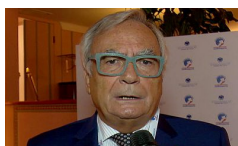
Confmare contro la richiesta Ue sulle tasse alle AdSp