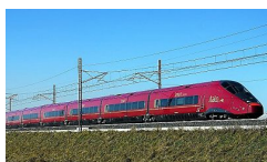
Linea AV, approvato lotto "Ingresso ovest di Verona"