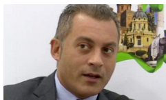
Msc Cruises e Costa Crociere gestiranno i terminali Sicilia occidentale