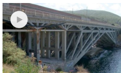
Sicurezza di ponti e sottopassi: a Livorno situazione sotto controllo