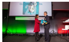
Presentazione calendario 2020 Guardia Costiera